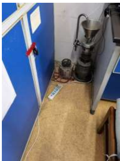
(6) 419 配置的化学试剂品标签不全，门口通道被堵。